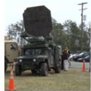
Nicht-tötende Hitzestrahlenwaffe der US-Armee (Active Denial System)

Mit der neuartigen 5G-Technologie dürfte es leicht fallen, Protestbewegungen zu lancieren und Meinungen zu manipulieren. Im äußersten Fall können mit Mikrowellenwaffen demonstrative Aktionen zerstreut werden. Bereits Anfang der 2000er Jahre wurde eine solche Waffe ("Active Denial-System") im hochfrequenten Spektrum von 95 GHz an 13.000 Personen "erfolgreich" getestet. 24 Diese Waffe erzeugt Hitzestrahlen und ist deshalb geeignet, Menschen auf Distanz zu halten.